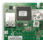
IP Multi-Socket Plug-in Modul 669915

Ein einfach zu installierendes Steck-Modul, das die Anbindung an ein TCP/IP Netzwerk ermöglicht. Ermöglicht das Versenden von E-Mails, Leitstellenprotokolle (SIA-IP) oder die Anbindung an die RISCO Cloud.