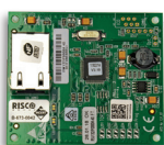
Plug-in TCP/IP Modul 669914

Ein einfach zu installierendes Steck-Modul, für Sprachanrufe, SMS, Fernsteuerung, Leitstellenprotokolle und Cloudanbindung über 3G- Netzwerke. Neben der Cloudverbindung über 3G können parallel Sprachanrufe oder Leitstellenübertragungen über dieses Modul erfolgen.